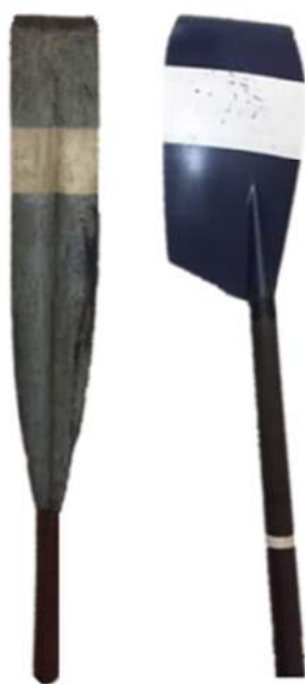
現在のエイト用オール(右)に比べるとブレードが細長く、フィニッシュでバックをとる漕法だった。