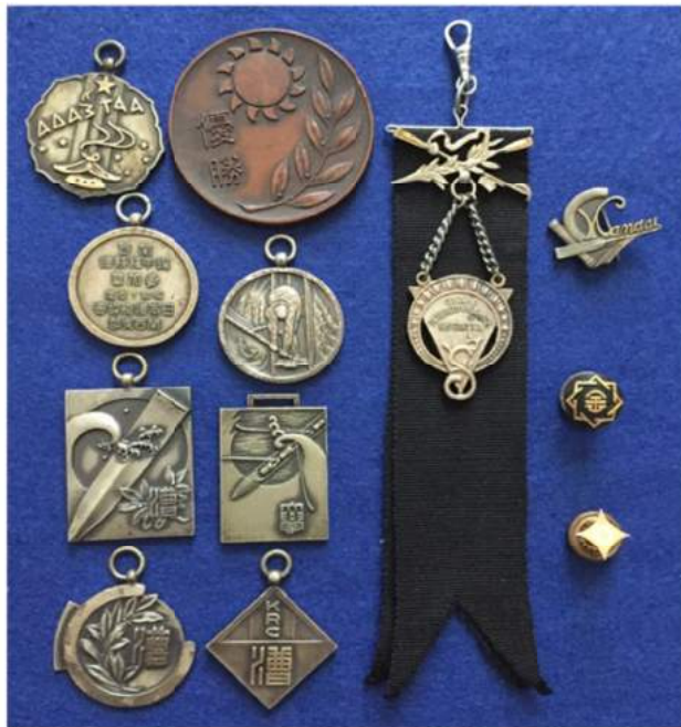
黒リボン付のメダルは昭和10(1935)年の全日本学生選手権競漕(インカレ)の参加賞。東西対抗形式で関東代表の早稲田大学に敗れ、準優勝・銀メダルに相当する。